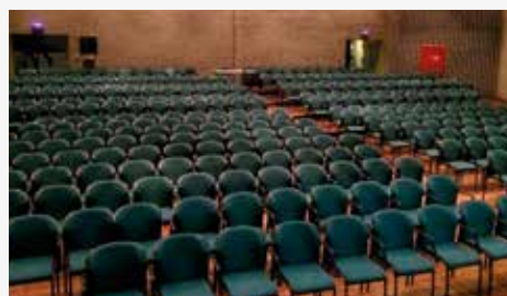
Deze stoelen worden vervangen door een uitschuifbare tribune

Bestel alvast je tickets via www.ccdeborre.be